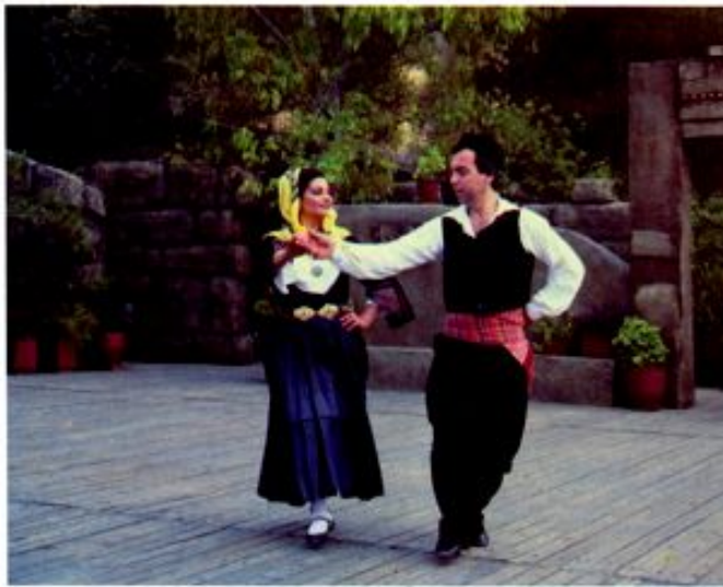
무브이(Euboea)성 지방의 '기디움'을 추고 있는 커플.

알키스 라프티스 ALKIS RAFTIS 그리스 사회학자. 1948년 그리스무용의장인 도라 스트라우(Dora Stralou)와 공동 IDC 회원으로 'The World of Greek Dance(1987)'를 포함하여 다수의 책을 썼다.