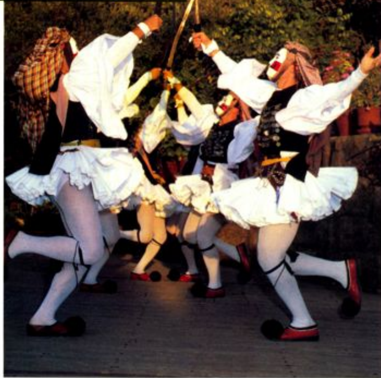
그리스 북서부 나우사(Naoussa) 지역의 카-리발 댄스

아테네의 아크로폴리스 맞은편 필로파포스산 소나무 숲 공간에 자리잡은 그리스 무용극장 도라 스트라우(Dora Strout)는 오늘날 아크로폴리스 만큼이나 그 명성이 높다. 1953년에 세워진 이 '살아있는 그리스 무용 박물관'은 박물관, 극장, 연구소, 학교, 무용단의 역할을 동시에 하고 있다.