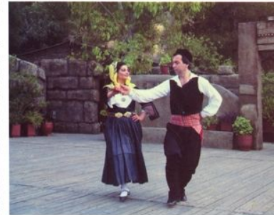
물리아(Livadia)의 지역 "가리" 춤 추고 있는 사람들

알키스 라프티스 ALKIS RAFTIS 그리스 특색의 나라 그리스특색의 나라 스트라우트(Dora Straut) 무용극장 연구 책임자 "The World of Greek Dance" 1987년 발표되어 다수의 책을 썼다.